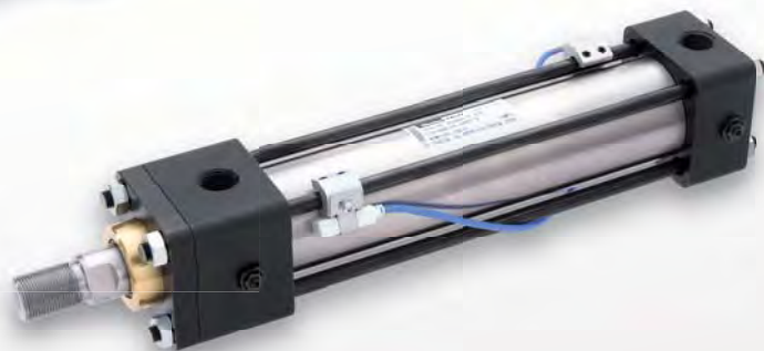
スイッチセット 耐熱 Max.130°C