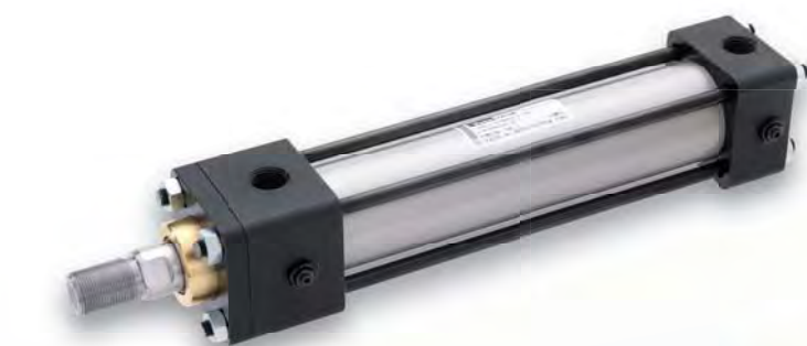
標準形 耐熱 Max.150°C